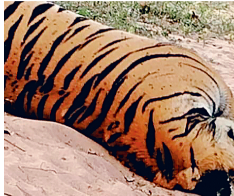
एक वर्ष के भीतर दो बाघों की मौत

बैकुंठपुर वनमंडल में दो दिन पूर्व मृत अवस्था में वयस्क नर बाघ मिलने से राज्य में बाघों की सुरक्षा पर एक बार फिर से सवालियांना निशान लग रहा है। बाघ के शिकार की एक साल के भीतर यह दूसरी घटना है। इसके पूर्व जनवरी में सारंगढ़-बिलाईगढ़ वनमंडल में एक बाघ को मार कर गाड़ दिया गया था। बैकुंठपुर में बाघ की जो बाँड़ी मिली है, आशंका व्यक्त की जा रही है, ग्रामीणों ने बाघ को जहर देकर मार दिया है। बाघ की बाँड़ी रहवासी क्षेत्र में मिली है। वन विभाग को घटना की जानकारी दो दिन के बाद मिली।